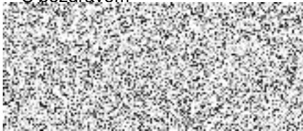
Vedoucí oddělení SEM sítě ČEZ Distribuce, a. s.